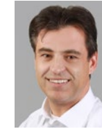
Klaus Sonnberger Werkstattmanagement & Lackierzubehör

PC/Hardware/Standowin: +49/9721/941 45-91